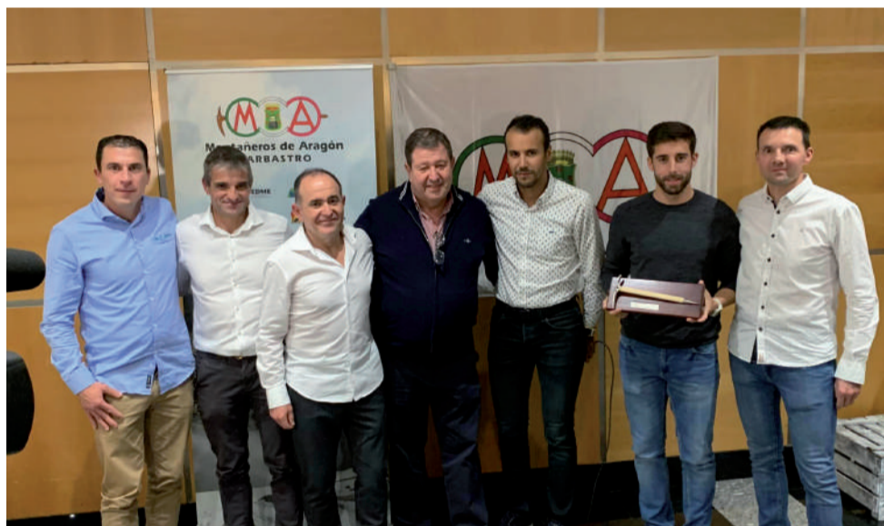
El Reto Barbastro-Posets fue premiado en la Cena de la Montaña 2023

de Los Andes o el Himalaya. Los componentes del Reo Barbastro-Posets es posible que se sumerjan en un nuevo desafío, aunque de mayor dificultad.