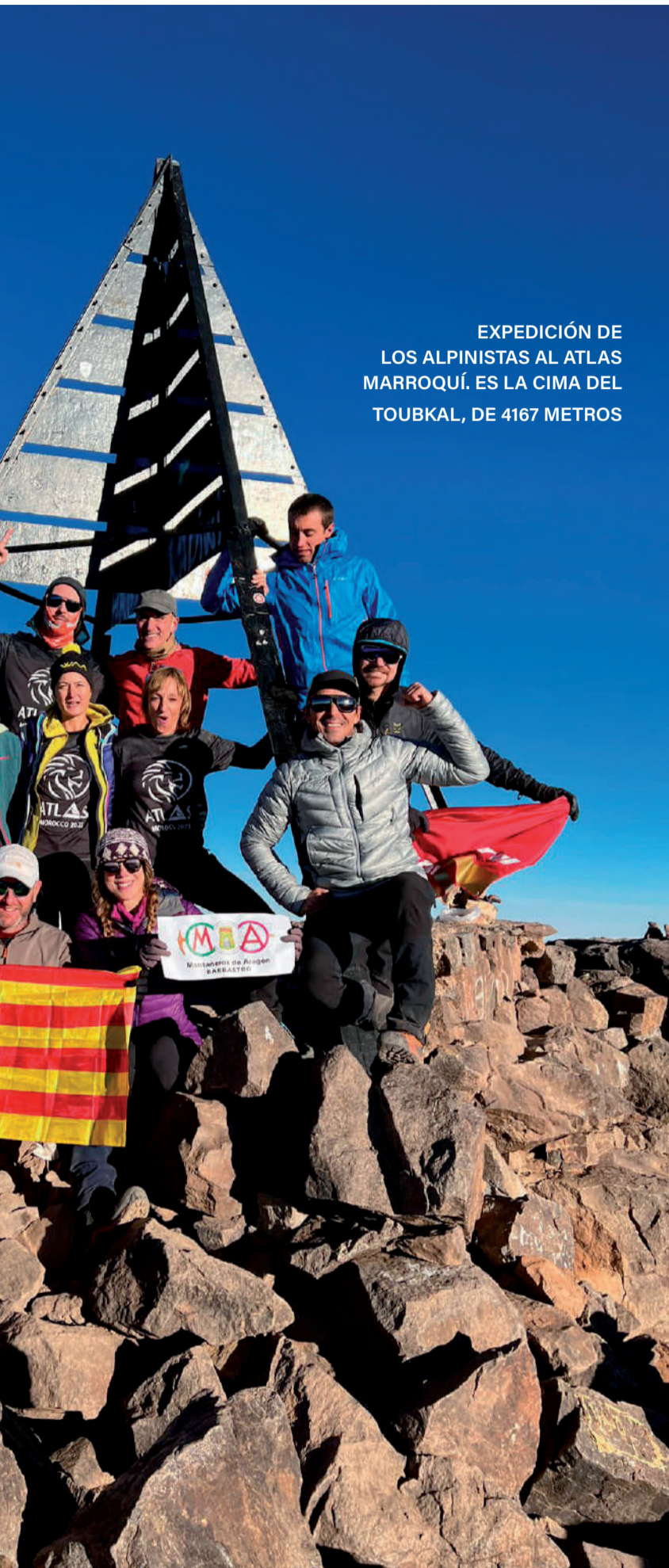
EXPEDICIÓN DE LOS ALPINISTAS AL ATLAS MARROQUÍ. ES LA CIMA DEL TOUBKAL, DE 4167 METROS